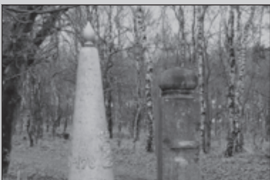
De Beverbeek-route 25

Mooie holle weggetjes tijdens de clubreis Kanne-Dalhem