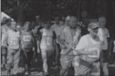
Wandelevenement Weert 12-14

CLUBBLAD VAN WSV OLAT • JAARGANG 33 • NUMMER 6 • JUNI 2007