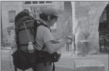
Pelgrim met een missie 20-21